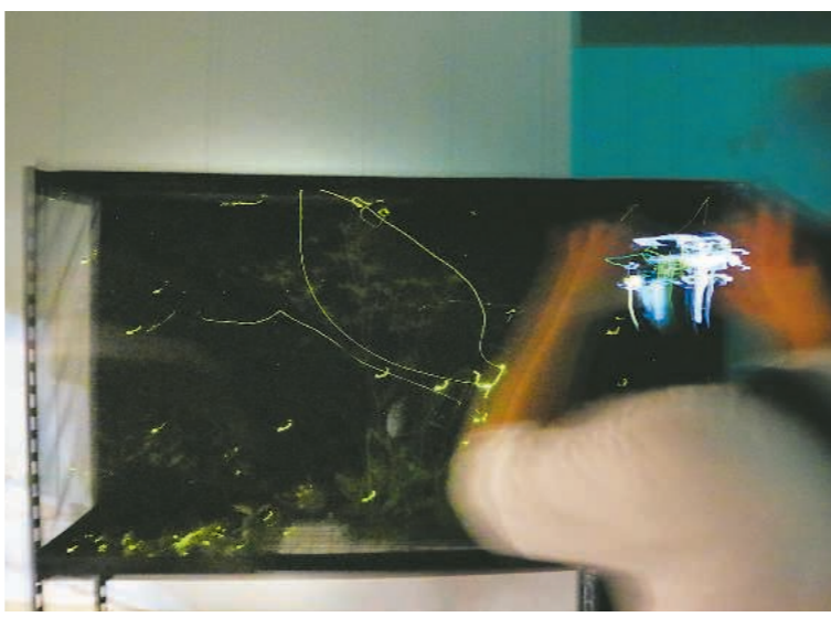
暗がりにホタルのともす光が曲線を描く