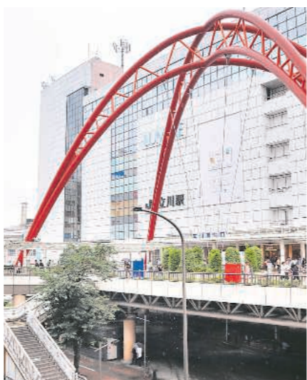
18万人が暮らす立川市の玄関口 JR立川駅の南口